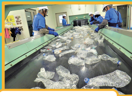
手選別コンベヤ 手作業で不適物・有害物 (残さ A) を除去。