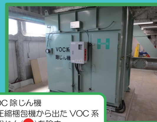
VOC 除じん機 圧縮梱包機から出た VOC 系の粉じん (C) を除去。