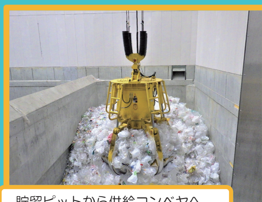
貯留ピットから供給コンベヤへ。