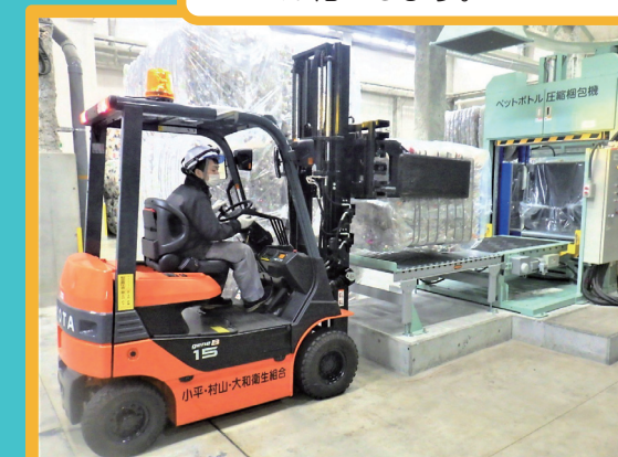
運搬しやすいよう圧縮梱包機で“ボール化”します。