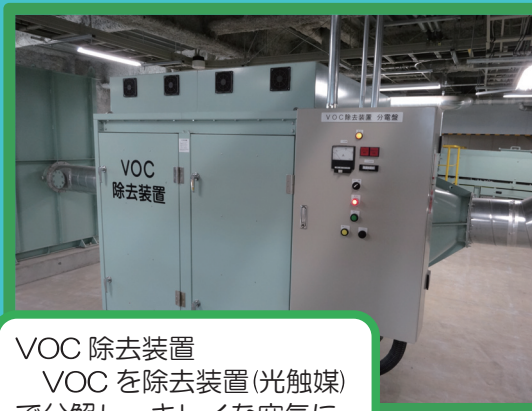
VOC 除去装置 VOC を除去装置 (光触媒) で分解し、キレイな空気。