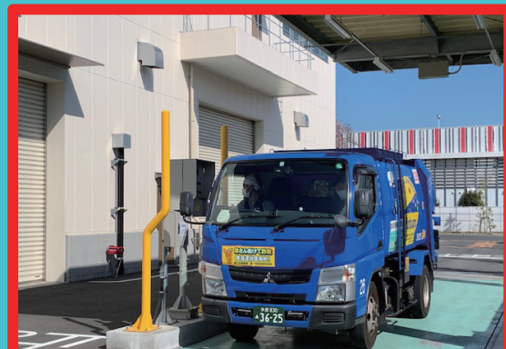
入口計量機で重さを測定。

揮発性有機化合物 (Volatile Organic Compounds) の略称で、塗料、印刷インキ、接着剤、洗浄剤、ガソリン、シンナーなどに含まれるトルエン、キシレン、酢酸エチルなどが代表的な物質。