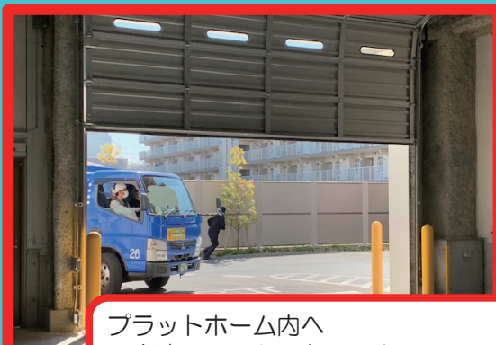
プラットフォーム内へ高速シャッターとエアカーテンで防音・防臭。