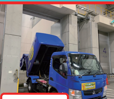
貯留ピットに投入。