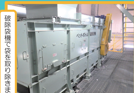
破砕袋機で袋を取り除きます。