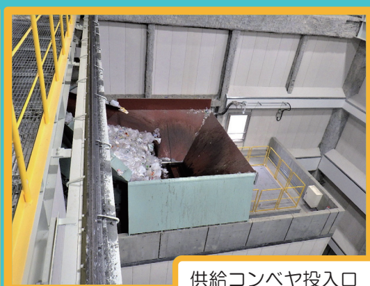
供給コンベヤ投入口