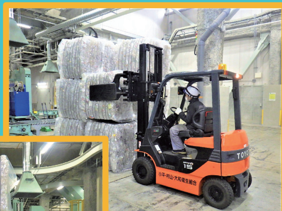
ボール 回収されたペットボトル (資源物) を圧縮してかたまりにしたもの